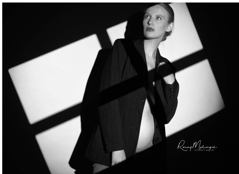
Romy Malengre FOTOGRAFIE & MEDIA